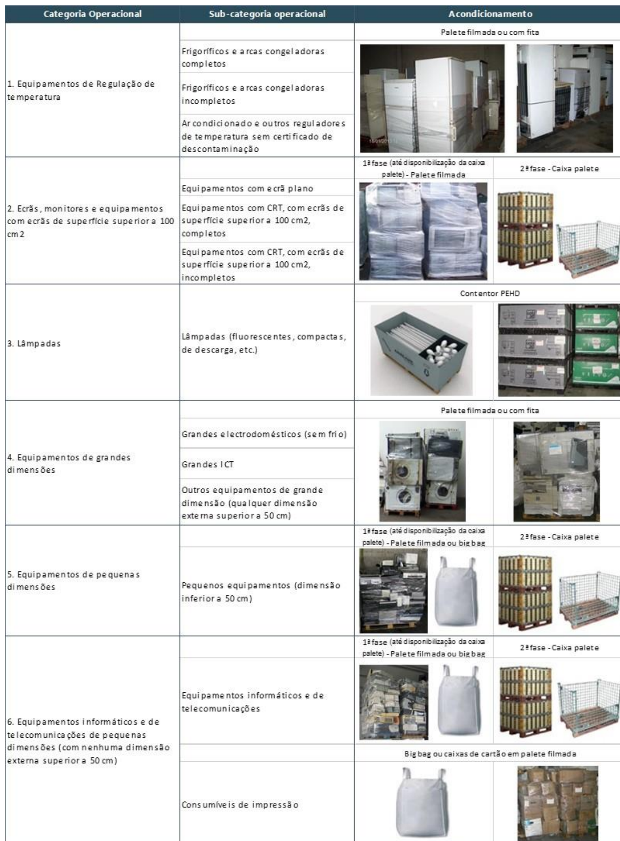
Tabela 2 – Meios de acondicionamento de entrega dos REEE